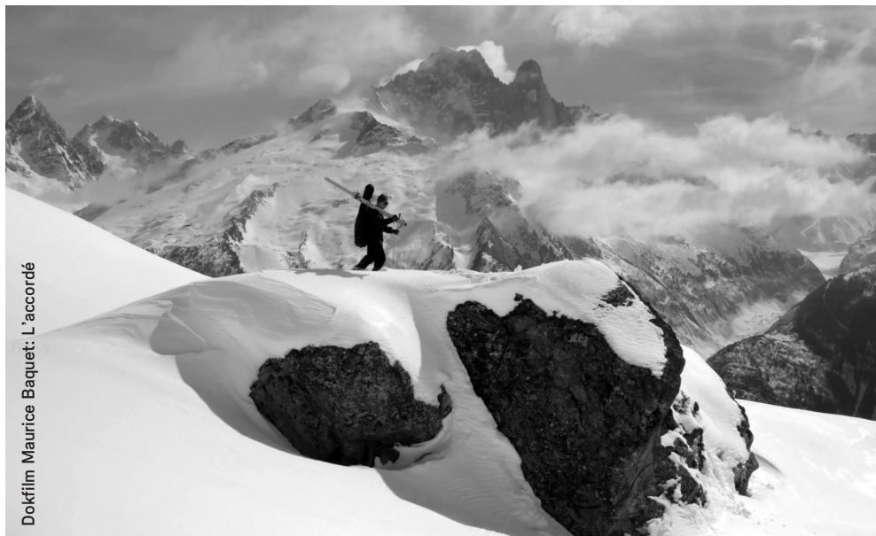
Dokfilm Maurice Baquet: L'accordé

UT — Untertitel OT — Obertitel oW — ohne Worte